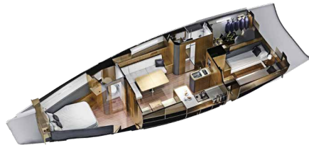
3-Kabinen-Layout 3-cabin layout